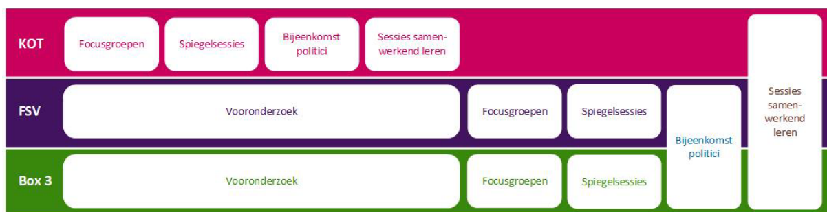
Figuur 1. Dataverzamelingmethoden per hersteloperatie

Dit onderzoek richt zich op drie hersteloperaties (KOT, FSV en box 3) en vier sleutelpartijen (benadeelden, medewerkers uitvoeringsdiensten, medewerkers van beleidsafdelingen en politici). Per hersteloperatie zetten we dezelfde onderzoeksmethoden in voor dezelfde betrokken partijen. Voor de hersteloperatie FSV en box 3 voeren we ook vooronderzoeken uit. Een overzicht van de gebruikte onderzoeksmethoden is te vinden in figuur 1. De focus van de dataverzameling is gericht op het per hersteloperatie in kaart brengen van de invulling van de leidende principes.